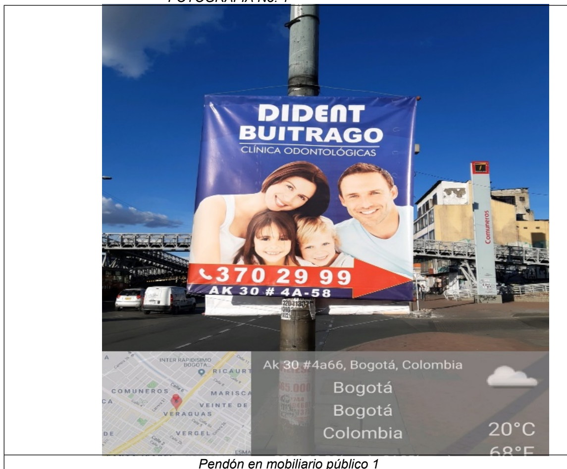
Pendón en mobiliario público 1